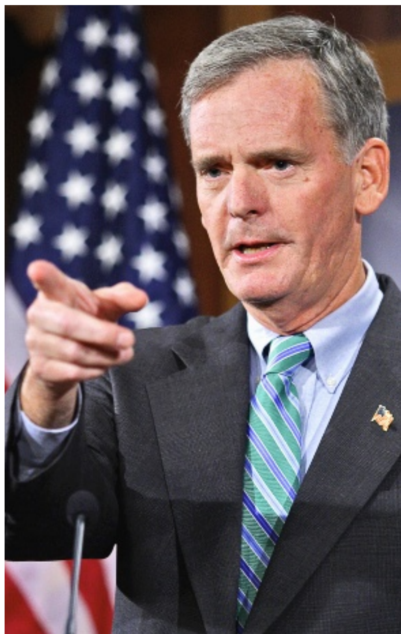
► El senador Judd Gregg, principal negociador republicano, consideró que las negociaciones tuvieron un buen resultado.